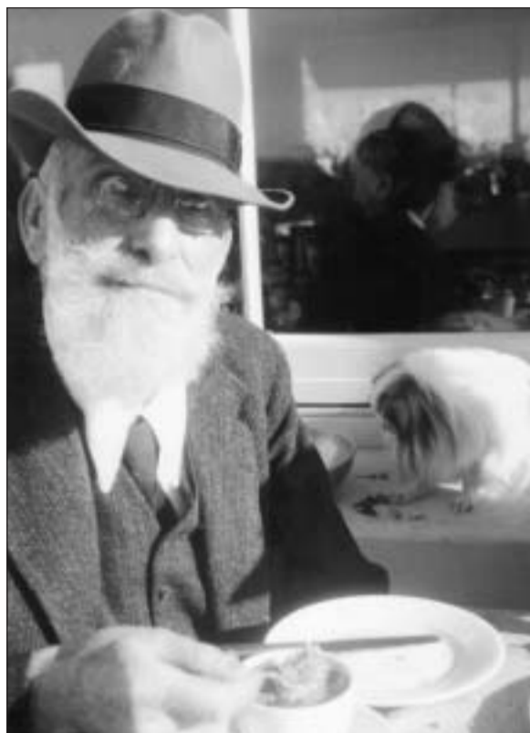
Il bab dal «Birchermüesli» e pionier da la medischina cumplexsiva biologica, Maximilian Oskar Bircher-Benner gauda sia «Spys».