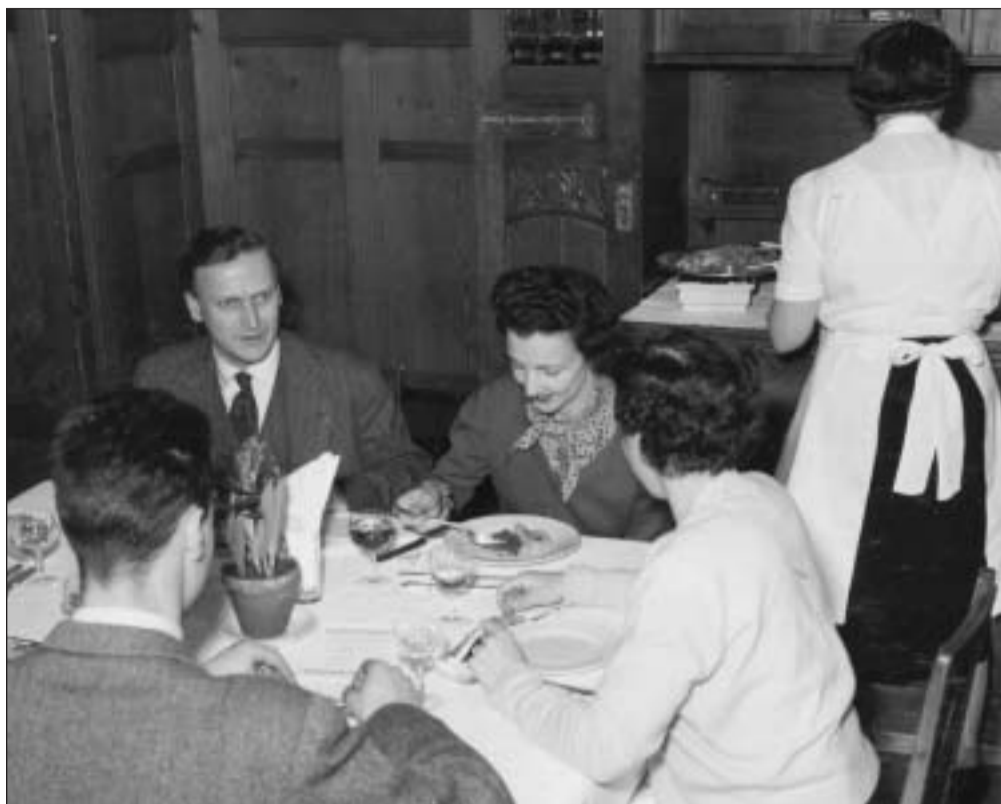
In dals numerus hosps prominents da tut il mund: Il violinist e dirigent american Yehudi Menuhin cun consorta vid la maisa da la clinica Bircher-Benner (enturn 1950).