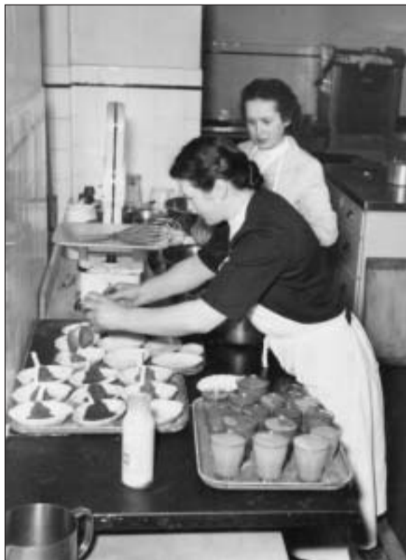
En la cuschna gronda da la clinica Bircher-Benner preparan bieras dunnas il «Birchermüesli» tenor recept original.

Dals 29-04-04 enfin ils 31-01-04 deditgescha il museum «Mühlerama» en il mulin Turitg-Tiefenbrunnen in'exposiziun speziala al «Birchermüesli» ( www.muehlerama.ch ).